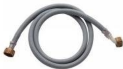
Tuyau raccordement eau